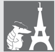
L'éducation en France

Est-ce que vous étiez un(e) élève modèle, moyen(ne), ou nul(le)? Et votre partenaire? Expliquez.