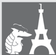
Les grèves (Strikes)

Les grèves font parties de la vie universitaire française. Les étudiants et les profs manifestent souvent, par exemple pour les salaires compétitifs des profs ou contre les frais de scolarité qui montent. Quand il y a la grève, il n'y a plus de cours pour les étudiants, la fac est bloquée, fermée. Quelquefois, le blocage peut durer longtemps, même quelques semaines.